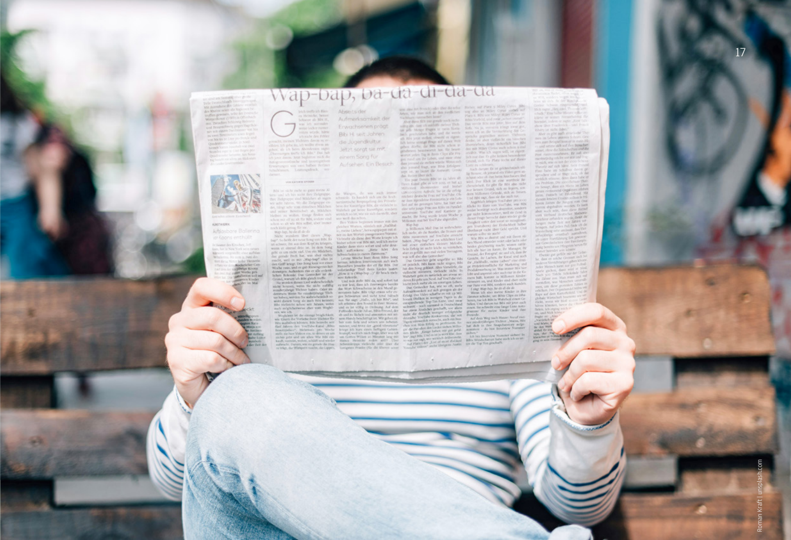
Roman Kraft | iustplatz.com